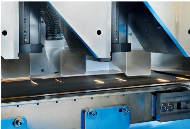
Bild 2: Hoher Durchsatz: Beim Erzeugen der Lochstrukturen arbeitet der Ultrakurzpuls laser mit vier Scanner-Modulen, die mit jeweils sechs Teilstrahlern ausgestattet sind.

----- FORSCHUNG KOMPAKT 4. April 2023 || Seite 4 | 5 -----